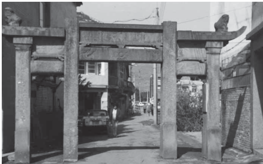
圖 4-7 日治第二年震後殘存之周氏節孝坊照（本照片約為民國 65 年所攝）