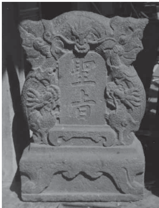
圖 4-8 周氏節孝坊日治第二年震後聖旨護石存置於北投大同街 107-109 號屋簷下近照（本照片拍攝時周氏節孝坊仍未修護）