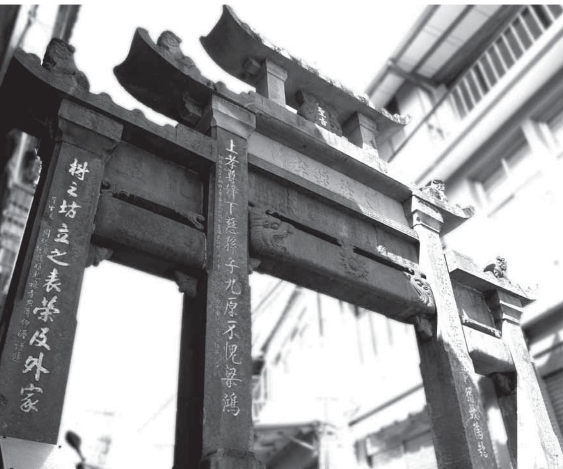
圖 4-9 現今周氏節孝坊照