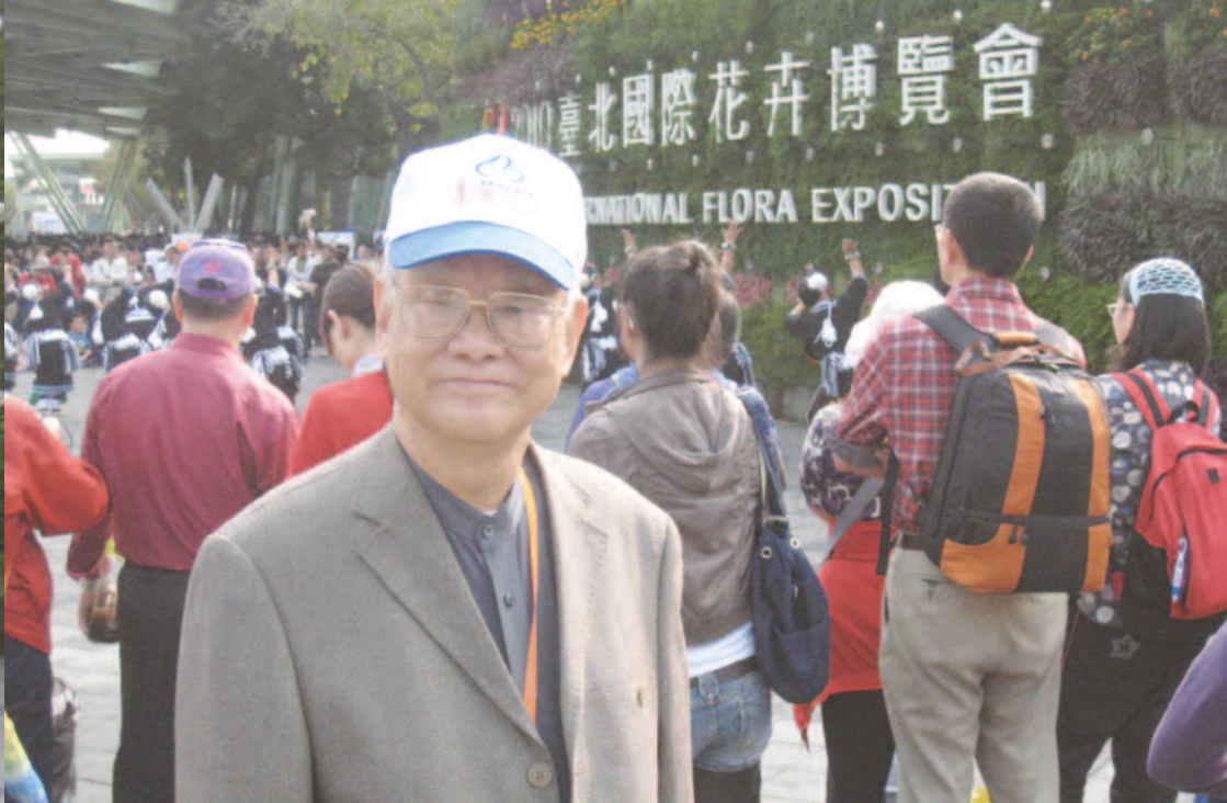
看臺北花卉博覽會