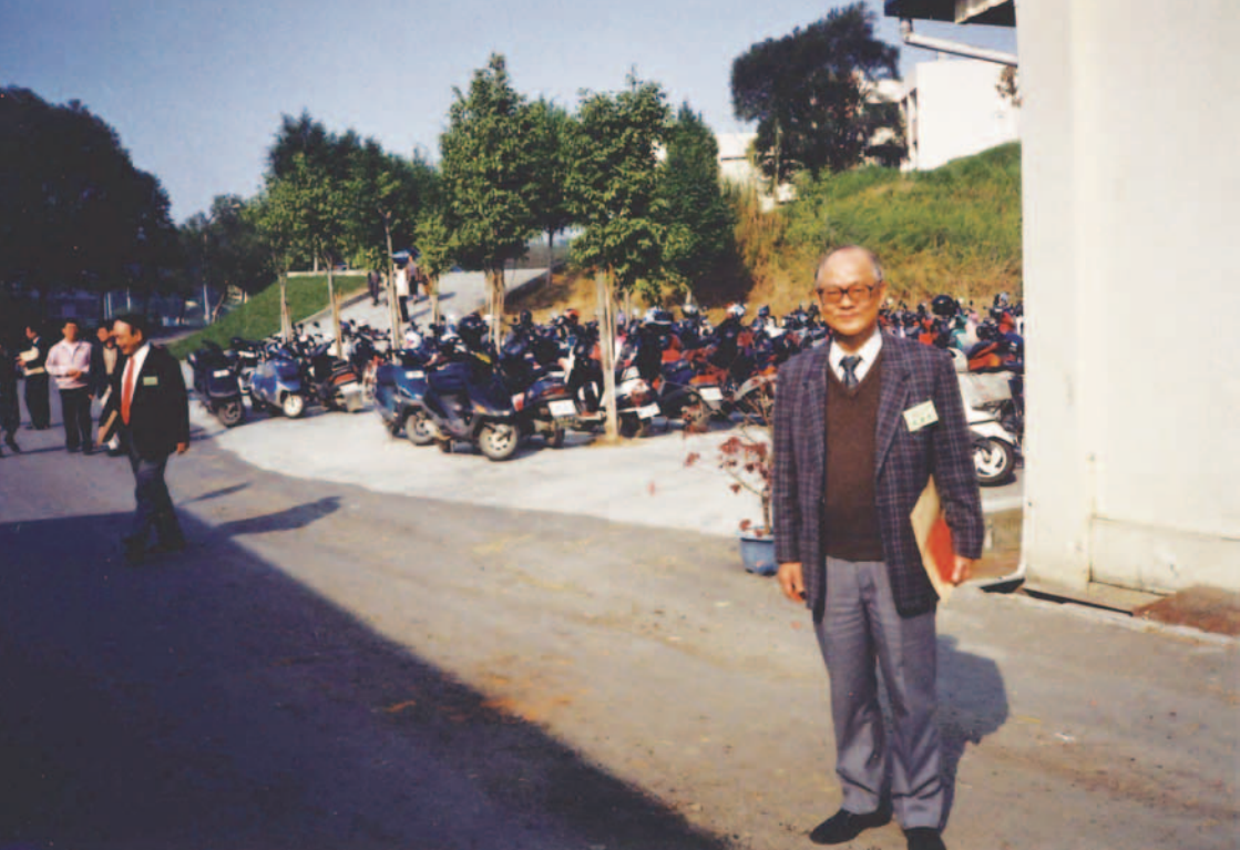
臺灣到處停滿摩托車

臺灣機動車太多，光是汽車，已近五百萬輛。再加上近八百萬輛的電單車，總數共達一千三百萬輛。以一個兩千萬人口的地區，這個比例也夠大的了。而且，據說現在每年還以百分之十五的速度增長。