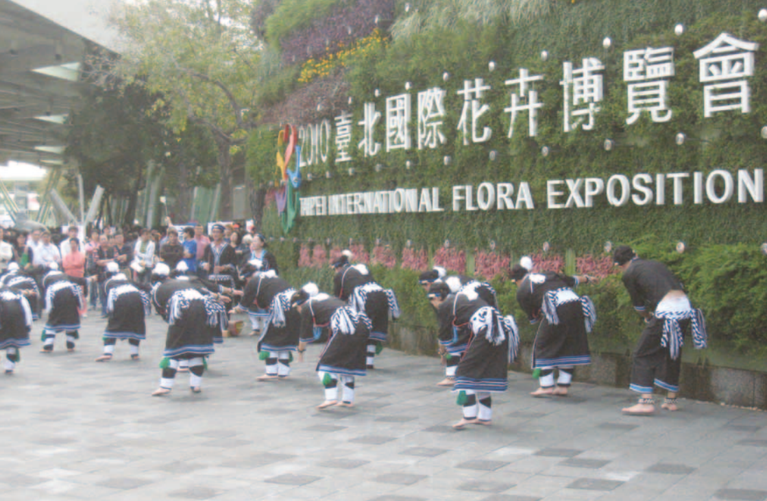
在臺北花卉博覽會前的舞蹈表演

極刑處決。又如毛澤東的孫子毛新宇，也是在那一次見面，並拍了合照。當年他似乎還沒有參加解放軍，而今已是一位將軍了。